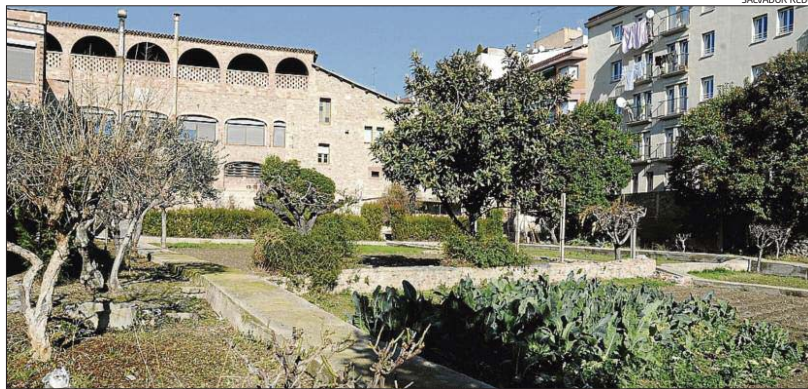
L'hort que hi ha al darrere del convent, més al cantó del carrer Arbonés. La finca té 4.200 metres quadrats

► Les religioses diuen que davant la probable desaparició de la comunitat volen garantir que la finca tingui un ús social