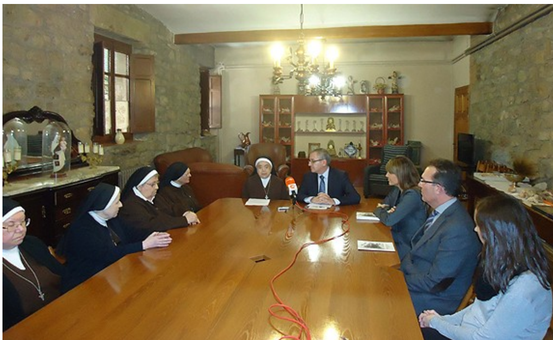
Roda de premsa d'anunci de la donació del Monestir de les Germanes Caputxines.

La previsió és poder convertir el convent en una residència per a persones amb problemes de dependència