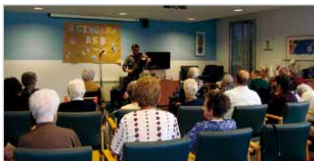
D'esquerra a dreta, imatge del centre de Sant Vicenç de Castellet i del centre de Callús aquest mes de juny

Aquest juny dos centres de la FSSM fan anys. La Residència Assistida i Centre de Dia de Sant Vicenç de Castellet celebra 15 anys amb una sortida a Món Sant Benet i activitats intergeneracionals que compten amb els alumnes de l'Escola Puigsoler. Des de la Residència de Callús se celebren els 7 anys del centre a través d'una setmana temàtica al voltant de l'activitat física. Els usuaris del centre han participat a la sortida anual que els ha portat a conèixer la Fundació Ampans. El jardí va ser un dels llocs de visita en què la majoria d'usuaris va adquirir una planta.