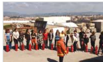
Imatge de la sessió de formació a Bufalvent

cies per assegurar el funcionament. La implantació del nou sistema informàtic finalitzarà a finals de juliol.