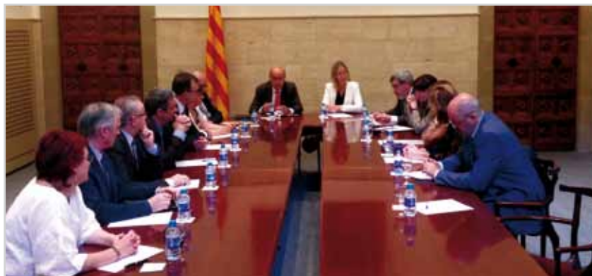
Manel Valls, tercer per l'esquerra, en la reunió que va comptar amb els consellers Boi Ruiz i Neus Munté

professionals de reconegut prestigi en el sector social i sanitari del país. La darrera reunió del PIAISS, celebrada al Palau de la Generalitat, ha