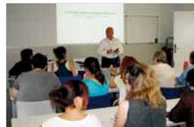
Imatge del curs impartit a la FUB

conèixer els elements integrants de l'equip assistencial, definir els aspectes bàsics de lideratge assistencial i augmentar i millorar els coneixements sobre les relacions professionals. El curs combina la teoria amb la pràctica en què els alumnes tenen un paper actiu en la resolució de casos i pràctiques que es plantegen.