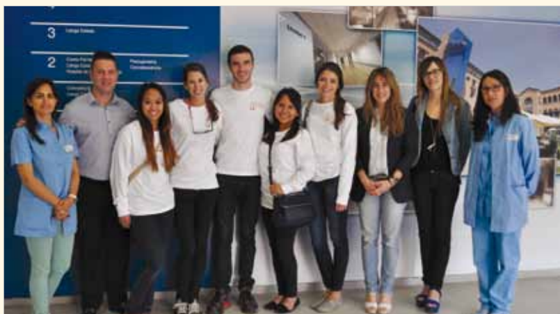
Fotografia de grup amb els alumnes nord-americans durant la seva visita a la FSSM

El centre d'on provenen els alumnes és privat i és pioner en simulació. Imparteix les titulacions de graduat en infermeria, graduat en ciències de la salut i graduat en salut pública, a part té una àmplia oferta de màsters i programes de doctorat. El motiu de la visita va