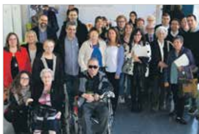
Presentació del document al centre UManresa-FUB

Els usuaris de la Residència i Centre de Dia de Sant Vicenç de Castellet han participat en la Diagnosi d'Envel·liment al Bages, que s'ha presentat a Manresa. El document dibuixa les polítiques d'envel·liment dels propers anys i es destaca la preocupació de la gent gran per envellir en soledat i sense recursos.