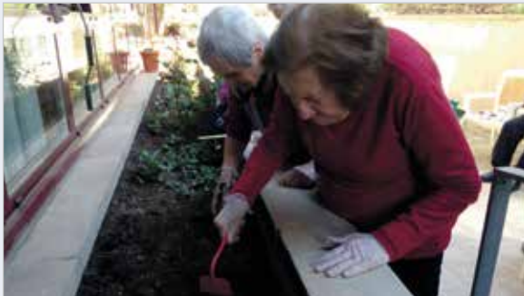
Tasques de jardineria a l'exterior del Centre de Dia de Manresa

A finals del mes d'abril els usuaris i usuàries del Centre de Dia de Manresa van fer tasques de jardineria en què van plantar diferents plantes, entre les quals unes tomaqueres a l'exterior del centre.