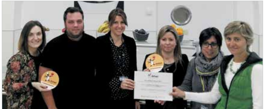
Lliurament de l'acreditació Amed a l'Hospital de Sant Andreu

La cafeteria de l'Hospital de Sant Andreu, gestionada per l'empresa de càtering Boris 45, ha rebut l'acreditació Amed, que garanteix als clients una oferta alimentària saludable. Els establiments acreditats amb aquesta certificació ofereixen als seus clients la garantia de saber que en les preparacions culinàries s'utilitza oli d'oliva o de gira-sol alt oleic, que afavoreixen la reducció dels índex de colesterol en sang.