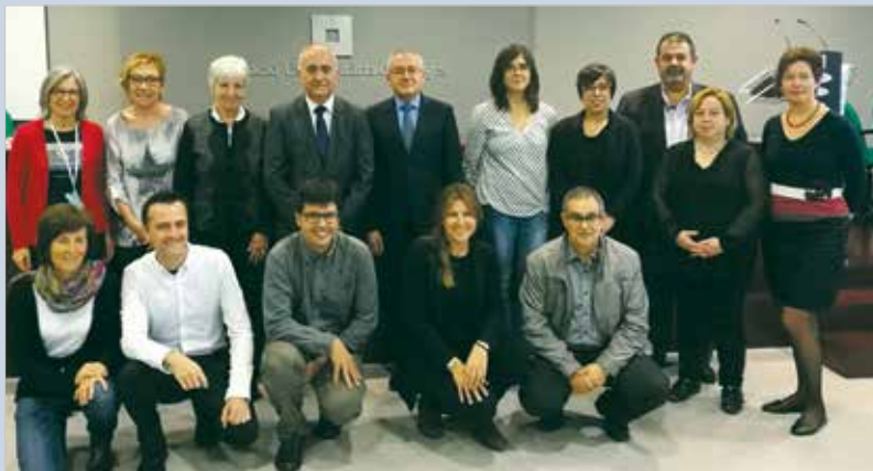
Fotografia de la signatura del conveni a la seu de la UManresa-FUB

Aquest mes de maig s'ha donat el tret de sortida a l'assaig clínic del projecte CAREGIVERSPRO-MMD, en què participa la FSSM. La iniciativa consisteix en una prova pilot adreçada als cuidadors i persones afectades d'Alzheimer. L'estrena del projecte s'ha fet visible amb la signatura del conveni entre la pròpia entitat amb l'Associació de Familiars d'Alzheimer i Altres Demències del Bages, Berguedà i Solsonès i la UManresa-FUB.