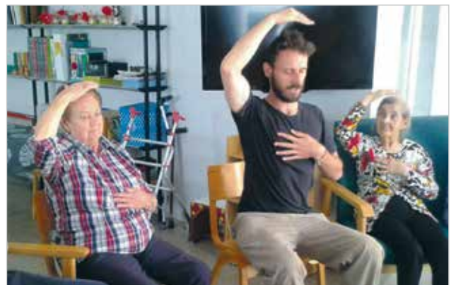
Imatge d'una de les sessions diàries a la Residència Catalunya

A finals del mes d'abril els usuaris i usuàries del Centre de Dia de Manresa van fer tasques de jardineria en què van plantar diferents plantes, entre les quals unes tomaqueres a l'exterior del centre.