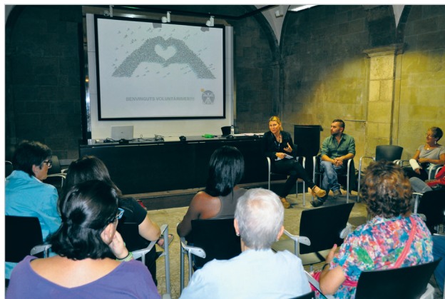
Sessió inicial del grup de voluntariat que aquest curs actua a la FSSM

El passat mes d'octubre es va celebrar la tercera jornada gastronòmica a la cafeteria de l'Hospital Sant Andreu. La cuina mediterrània va ser protagonista i va agafar el relleu a les cuines mexicana i oriental, presents en les dues primeres jornades.