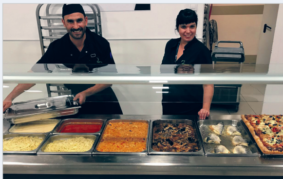
Fotografia de l'oferta gastronòmica amb tocs mediterranis

El passat mes d'octubre es va celebrar la tercera jornada gastronòmica a la cafeteria de l'Hospital Sant Andreu. La cuina mediterrània va ser protagonista i va agafar el relleu a les cuines mexicana i oriental, presents en les dues primeres jornades.