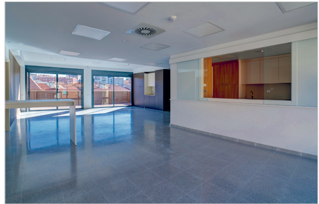
Diferents imatges de l'interior de l'equipament

El centre ha estat dissenyat per adaptar-se a les necessitats de cada persona a través d'espais càlids, diàfans i amables. Ubicada al bell mig del Centre Històric de Manresa, la nova residència oferirà 38 places noves i 30 places de centre de dia.