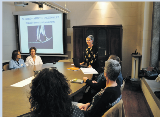
Imatge d'una de les trobades que es programen setmanalment