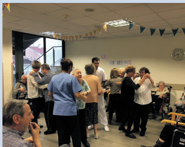
D'esquerra a dreta i de dalt a baix, imatge del taller de carbasses de la Residència Sant Sadurní, taller de panellets a la Residència Catalunya i ball de castanyada a la Residència Sant Andreu