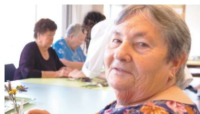
Setmana de la Gent Gran a Sant Vicenç

llet. Des de la residència es va fer una explicació del dia a dia dels usuaris i del funcionament de l'equipament. Els alumnes van poder fer preguntes i es va establir una bona estona de convivència entre persones de generacions ben diferents.