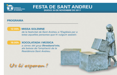
Fragment del cartell de la jornada festiva

La Fundació Sociosanitària de Manresa ho té tot a punt per celebrar la Festa de Sant Andreu aquest dijous dia 30. Els actes començaran amb una missa solemne a l'Església al migdia. A la tarda hi haurà xocolatada i música a càrrec del grup Stresband trio als baixos de l'ampliació de la Residència Sant Andreu. La jornada s'adreça als usuaris, familiars i professionals de la Residència i de l'Hospital.