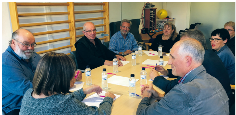
Imatge d'una de les darreres trobades dels grups focals amb la participació dels familiars

L'opinió dels familiars té una incidència directa en la manera de treballar a l'Hospital i a les residències de la FSSM. Cada centre programa una trobada anual en forma de grup focal amb la participació dels familiars. Les opinions i inquietuds exposades són recollides i adaptades en els procediments que segueixen els professionals. Els grups, formats per entre vuit i deu familiars, aporten informació molt valuosa que ajuda a millorar l'atenció a les persones.