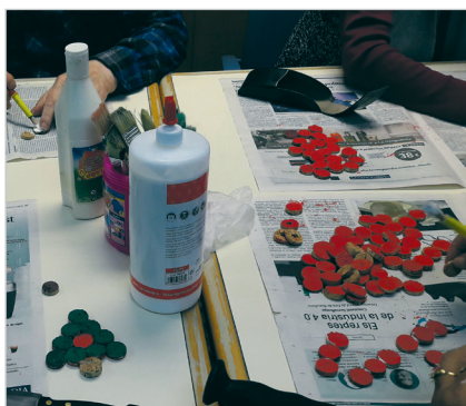
Detall del taller d'elaboració amb taps de suro

El Centre de Dia de Manresa col·labora amb La Marató de TV3 que aquest any recaptarà fons per ajudar a la investigació i la recerca de les malalties infeccioses. Els usuaris de l'equipament participen en un taller a través del qual elaboren uns arbres fets de taps de suro. A part del toc decoratiu, els arbres també es poden fer servir de posagots durant aquestes festes de Nadal.