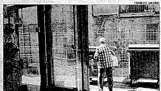
Contenidors davant la ferreteria del carrer Barreres número 14