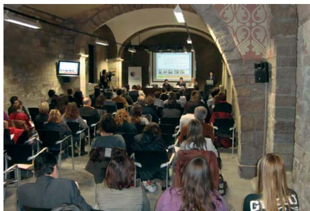
Presidència de la inauguració de la Jornada dedicada a les tecnologies de la informació i la salut