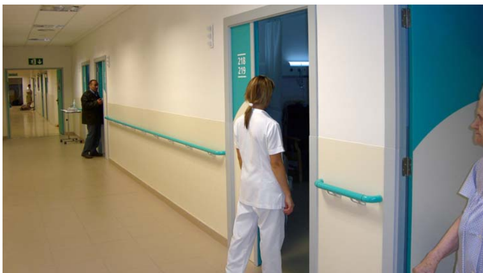
Una imatge del passadís de la segona planta després de les obres

Les inversions que ha fet la Fundació Sociosanitària de Manresa a la segona planta de l'Hospital de Sant Andreu es troben en una fase molt avançada. Una part de l'actuació, tant al passadís central com a les habitacions, està ja enllestida i sorgeix la línia de la posada al dia de les