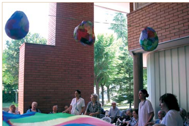
La residència assistida de la Font arriba als vint anys

Els responsables del centre destaquen la transformació del tipus de residents des de finals de la dècada dels anys 80 i fins a l'actualitat. Al principi, la majoria d'usuaris eren autònoms, mentre que ara les perso-