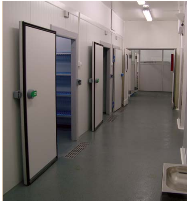
A l'esquerra, una part de la façana que es rehabilita. A la dreta, una part de l'equipament de la nova cuina

Les obres de rehabilitació de la façana de l'Hospital de Sant Andreu pel carrer Hospital avancen a bon ritme i les previsions indiquen que podrien estar acabades abans que arribi aquesta propera primavera. La remodelació afecta un total de 700 metres quadrats i se segueix la mateixa línia estètica de la façana principal, pel carrer Remei de Dalt. El cost total de les obres és de 520.000 euros.